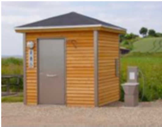
Illustration af toiletbygning