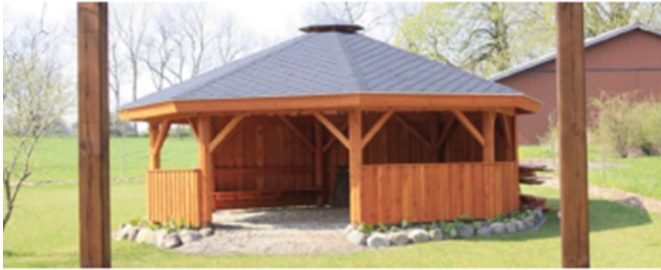
Illustration af bålhytte