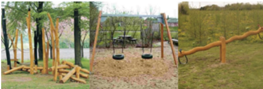
Illustration af legeplads